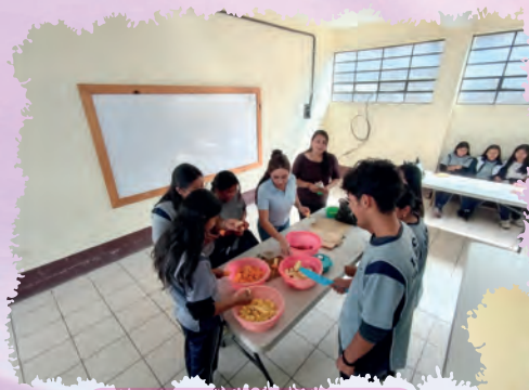
CURSO DE COCINA CON LOS ESTABLECIMIENTOS DEL MUNICIPIO