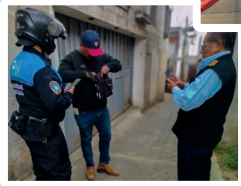
VERIFICACIÓN DE SOSPECHOSO EN CALLEJÓN