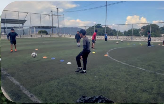
Academia de futbol