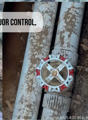
TRABAJOS EN REDES DE AGUA.