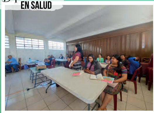
Diplomado EN SALUD