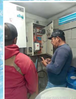
REPARACION Y MANTENIMIENTO EN LOS TABLEROS DE LOS POZOS ELECTRICOS..