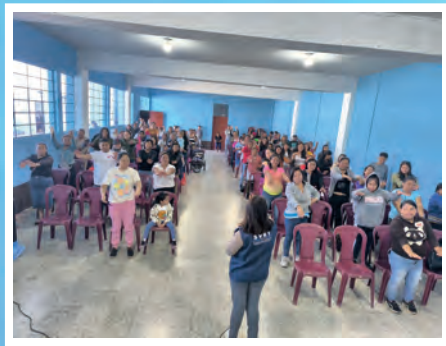
Taller a padres de familia