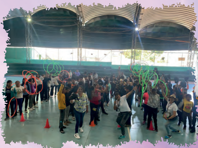
ACTIVIDADES RECREATIVAS CON ESTABLECIMIENTOS

La Dirección Municipal de la Mujer como parte de la Municipalidad de San Bartolomé Milpas Altas, Sacatepéquez, tiene como objetivo ofrecer atención gratuita a las mujeres promoviendo su fortalecimiento y el ejercicio pleno de sus derechos. Para ello, impulsa talleres enfocados en fomentar la equidad de género entre hombres y mujeres, contribuyendo al cambio cultural necesario para construir una sociedad más justa e igualitaria.