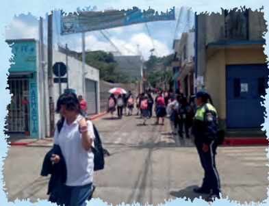
APOYO A CENTROS EDUCATIVOS