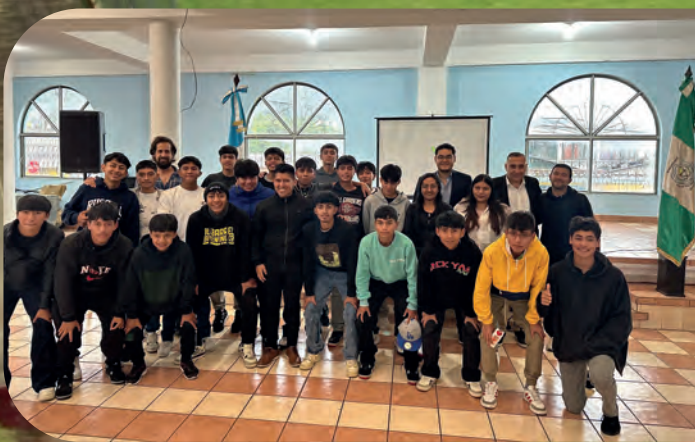
Taller motivacional deportivo