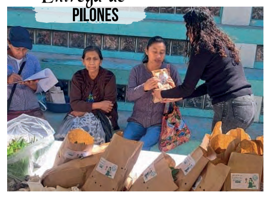
Entrega de PILONOS