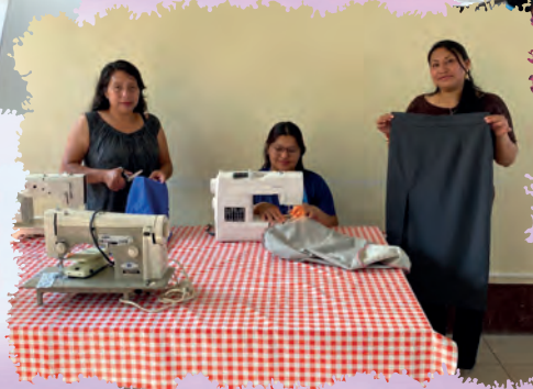
CURSO DE CONFECCIÓN