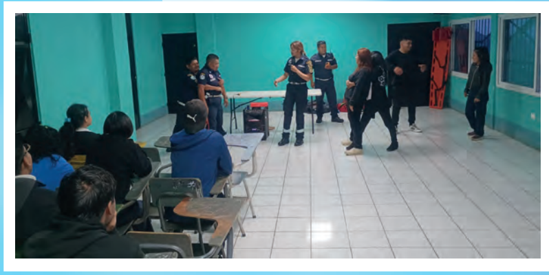
Taller de primeros auxilios