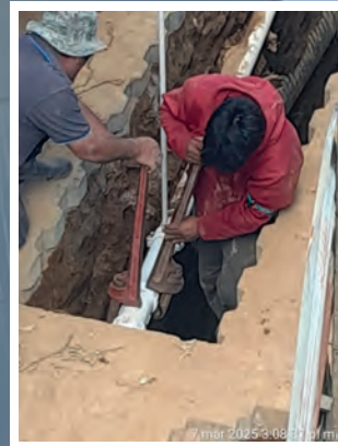
REPARACIÓN DE LAS FUGAS DE AGUA EN TUBERIA DE LA RED MUNICIPAL