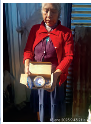
INSTALACIONES DE SERVICIOS NUEVOS EN DIFENTES SECTORES DEL MUNICIPIO.