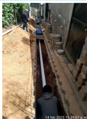
TRABAJOS DE MANTENIMIENTOS DE REDES DE AGUA POTABLE.