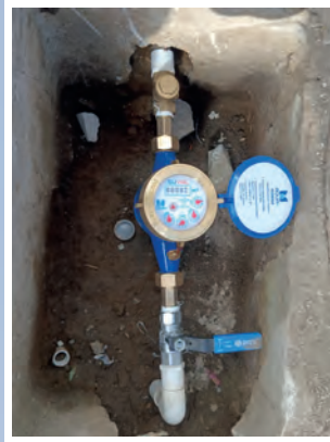
INSTALACION DE SERVICIOS DE AGUA POTABLE.