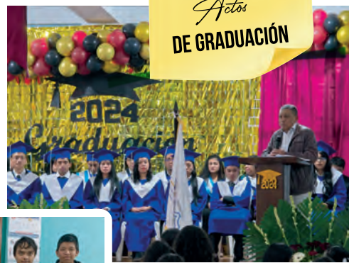
Actos DE GRADUACIÓN