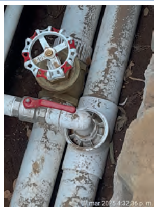
CAMBIO DE LLAVES DE PASO