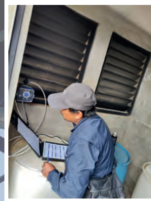
MANTENIMIENTO CON TECNOLOGIA ACTUALIZADA EN EL SISTEMA TECNICO DE CLORADO