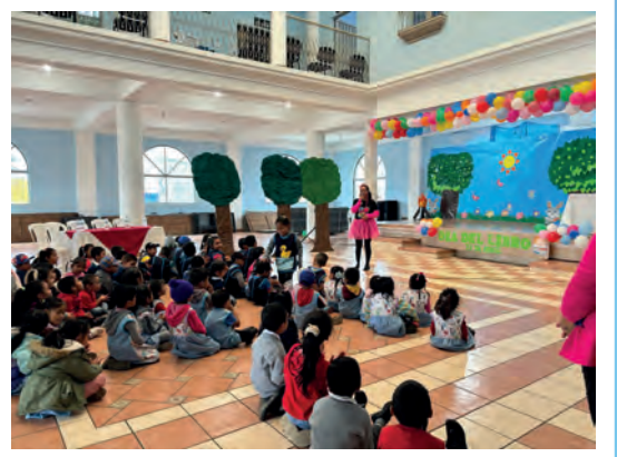
Día del libro