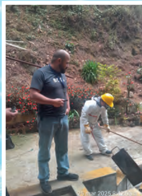
TOMA DE MUESTRAS FISICOQUIMICOS DE AGUA