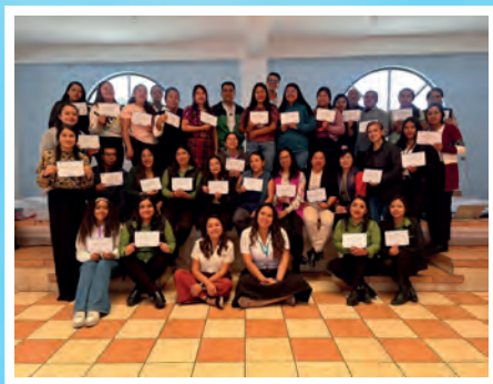
Programa de salud mental para docentes