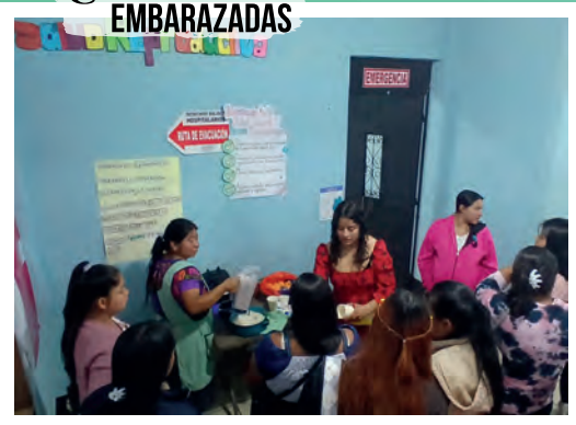
Club de EMBARAZADAS