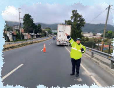
REGULACI N DEL TR NSITO VEHICULAR