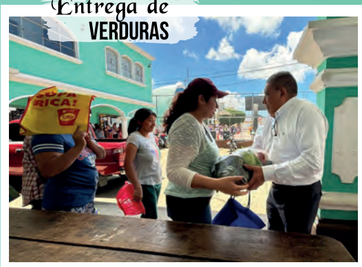
Entrega de VERDURAS