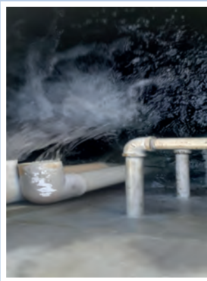
CAMBIO DE TUBERIAS EN TANQUES Y POZOS DEL SISTEMA..