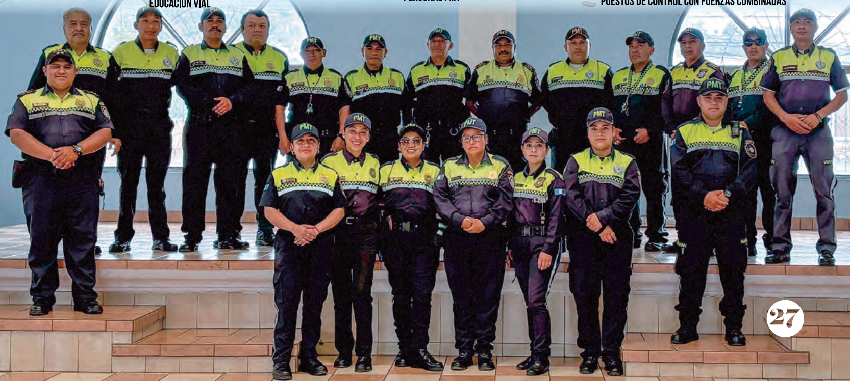
PUESTOS DE CONTROL CON FUERZAS COMBINADAS