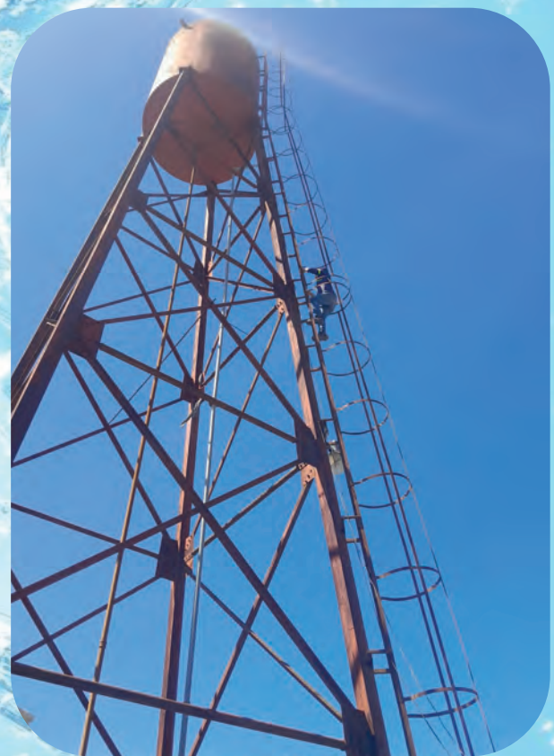
VERIFICACION DE TANQUES ELEVADOS DE LOS POZOS

La OMAS tiene un enfoque transdisciplinario y multidisciplinario dado que promueve la participación y sostenibilidad del servicio con un enfoque; intercomunitario, intermunicipal, internacional, inter-subjetivo, intergeneracional, intersubjetivo, interconfesional, interfamiliar, por ser un eje transversal en el desarrollo y cuidado de la vida.