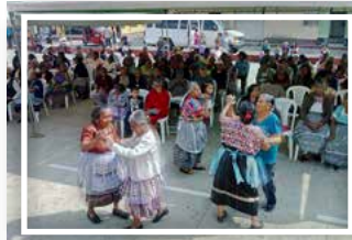
Actividad recreativa adulto mayor