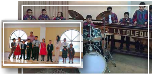
Actividades culturales; canto, declamación y oratoria. Cursos de Marimba y Banda