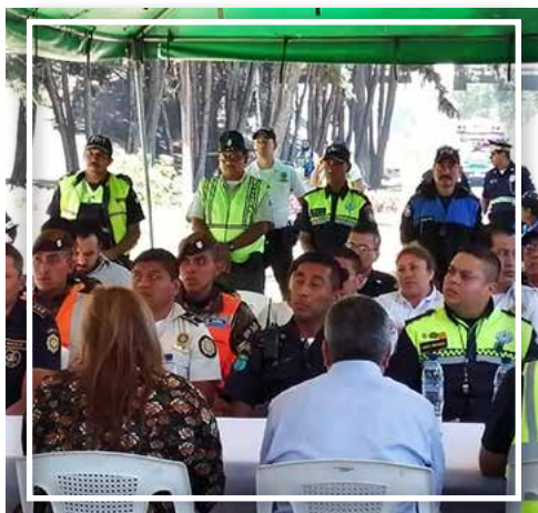
Coordinación con otras Intituciones del Estado para el trabajo en materia de salud y educación vial