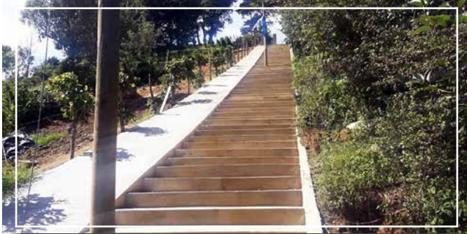
Adoquinado 7ma. calle zona 1