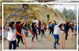
Actividad física para mujeres