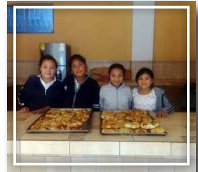
Cursos de panadería, para niños