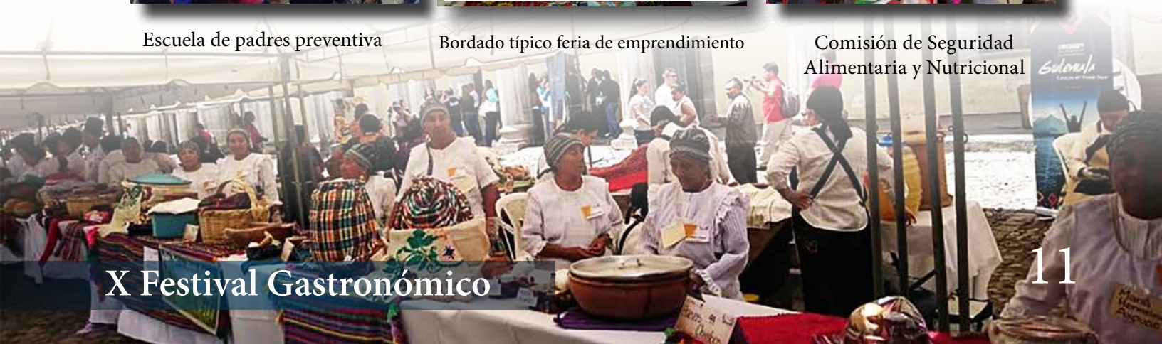
X Festival Gastronómico