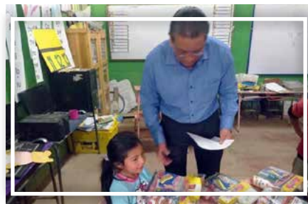
Entrega de material didáctico

Estas actividades están en Ley Integral de Protección a la Niñez y Adolescencia en la Sección II DERECHO A LA EDUCACION, CULTURA, DEPORTE Y RECREACIÓN ARTICULO 36.