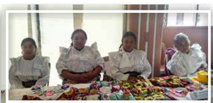
Bordado típico feria de emprendimiento