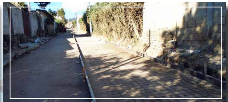
Pavimento 4ta. avenida zona 3