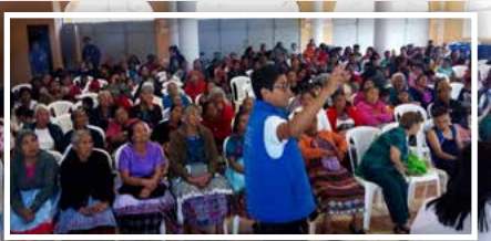
Día Internacional de la Mujer

La Dirección Municipal de la Mujer -DMM- es una oficina técnica de apoyo a la Municipalidad, que responde precisamente a la necesidad de atender de forma eficiente y eficaz las demandas específicas de las mujeres que habitan dentro de nuestro territorio municipal.