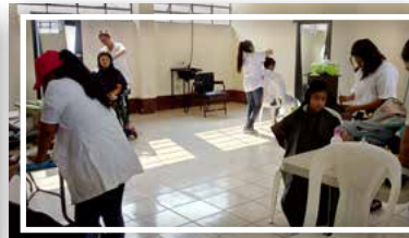
Curso de corte de cabello