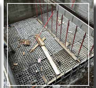
Plantas de tratamiento