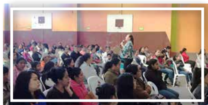
Escuela de padres preventiva