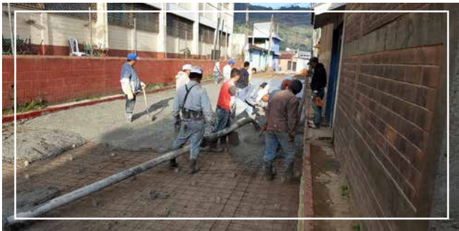
pavimento 3ra. calle zona 1