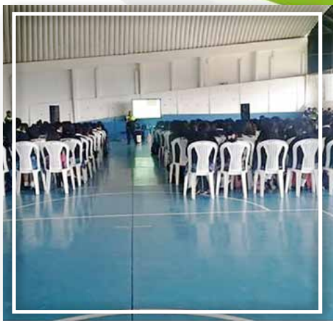
Capacitación y profesionalismo en las filas oficiales