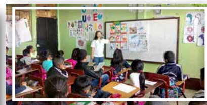
Comisión de Seguridad Alimentaria y Nutricional